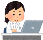
病院取りまとめ 責任者