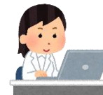
病院取りまとめ 責任者

※ 上記のメールとは別に、“翌日使用する練習問題”を 取りまとめ責任者のみへ送信